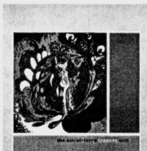
Astral-Terra Trapeze Unit: «Astral-Terra Trapeze Unit»

Επταμελές είναι και το σχήμα του σαξοφωνίστα και φλαουτίστα Kurt Hill Iselt, οι «Astral-Terra Trapeze Unit», αλλά με πιο συνηθισμένη σύνθεση (πνευστά, κιθάρα, μπάσο, τύμπανα). Το γκρουπ αυτό απ' το Σικάγο αν και κατά βάση χρησιμοποιεί στραίτη τζαζ φόρμες είναι μέσα στο πνεύμα της δημιουργικής σκηνης που ανθίζει σε αυτή την πόλη εδώ και αρκετές δεκαετίες.